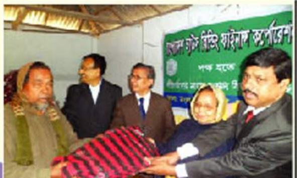
বাগেরহাট জেলার মংলা উপজেলায় শীতবস্ত্র বিতরণ