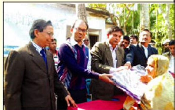
সাতক্ষীরা জেলার তালা উপজেলায় শীতবস্ত্র বিতরণ