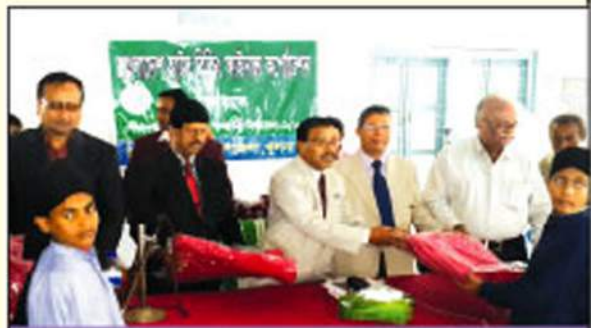
খুলনা জেলার পাইকগাছা উপজেলায় শীতবস্ত্র বিতরণ