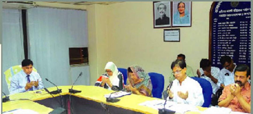
বিশেষ মাসিক সভায় ব্যবস্থাপনা পরিচালক ও উর্ধ্বতন কর্মকর্তাবৃন্দ

অনিবার্য কারণে সাম্প্রতিক সময়ে আদায় তৎপরতায় সদর দফতর কর্মকর্তাদের ফিল্ড অফিস পরিদর্শন এবং গ্রহীতাদের সাথে ব্যক্তিগত